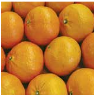
Mercado externo Export market