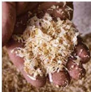
Producción industrial Industrial production