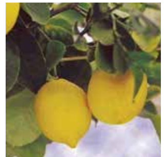
Nivel de ocupación Employment level