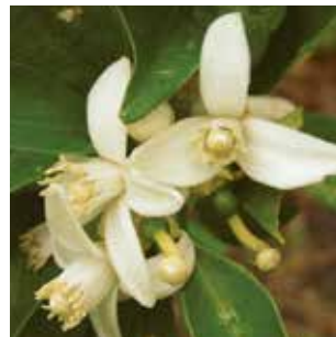
Exportaciones destino Destination exports